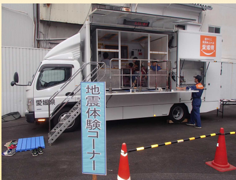
本物さながらのリアルな揺れ！