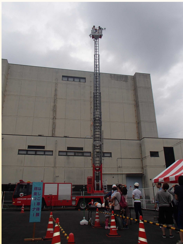
1番人気！はしご車体験搭乗

9月23日(土) 宇和島市中央町2丁目「ふれあい広場」にて市民の皆様に地震、火災等の恐ろしさと、備えの重要性を理解してもらうことを目的として「防災フェア」を開催しました。当日は天候にも恵まれ、たくさんのご家族の来場がありました。会場には地震体験車、煙体験テント、防災・消火訓練や車両展示などのコーナーを設け、市民の皆様に色々な体験をしていただきました。一番の人気は「はしご車体験搭乗」で、こども達は目を輝かせながら、地上20mの世界を楽しんでいました。各コーナーでの体験を通して防災に関する知識や技術を少しでも市民の皆様にお伝えすることができたと感じています。知りたい情報は、パソコンやスマートフォンで簡単に入手でき、様々な情報が溢れている現代ですが、情報の多さに惑わされることなく、災害を正しく理解し、正しく恐れることができるようになるための第一歩として、「防災フェア」での体験が役立てば嬉しく思います。