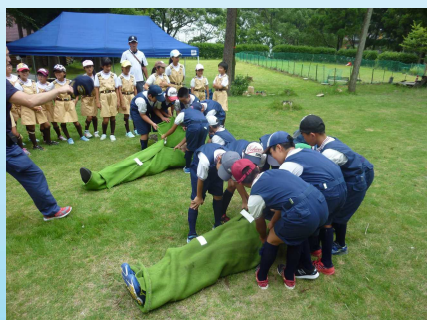
毛布を利用した搬送訓練