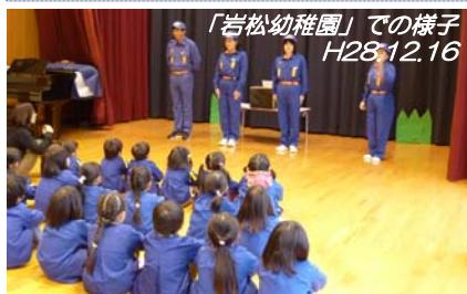
「岩松幼稚園」での様子 H28.12.16