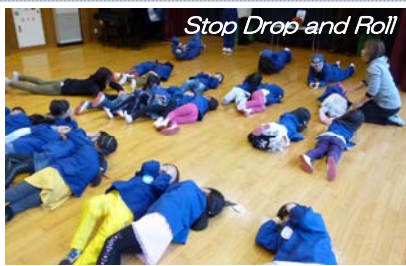
Stop Drop and Roll