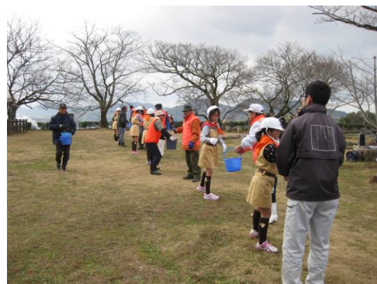
「鶴島小学校少年消防クラブ」・「城山を見守る会」によるバケツリレー

昭和24年1月26日に法隆寺金堂から出火した火災によって、世界的至宝と言われた金堂の壁十二面に描かれた仏画の大半が焼損しました。このような被害から文化財を守るとともに、国民一般の文化財愛護に関する意識の高揚を図るため、昭和30年から消防庁と文化庁の共唱により、1月26日を「文化財防火デー」と定めて、文化財建造物等における防火運動を全国で展開しています。文化財防火デーにあわせて宇和島市においても1月23日に「宇和島城防火訓練」を実施しました。