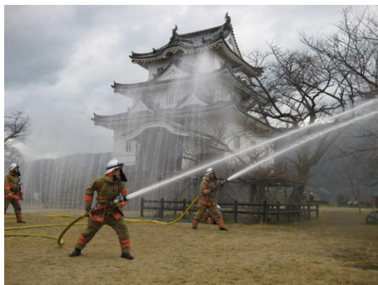
宇和島消防署による放水

昭和24年1月26日に法隆寺金堂から出火した火災によって、世界的至宝と言われた金堂の壁十二面に描かれた仏画の大半が焼損しました。このような被害から文化財を守るとともに、国民一般の文化財愛護に関する意識の高揚を図るため、昭和30年から消防庁と文化庁の共唱により、1月26日を「文化財防火デー」と定めて、文化財建造物等における防火運動を全国で展開しています。文化財防火デーにあわせて宇和島市においても1月23日に「宇和島城防火訓練」を実施しました。