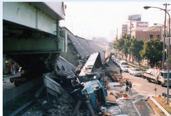
神戸市灘区国道43号