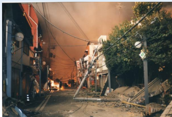
神戸市長田区商店街