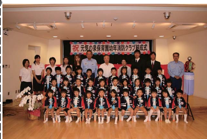
平成19年7月6日(金)10時00分~11時00分 元気の泉保育園幼年消防クラブの結成式が行われ、当消防本部管内16番目の幼年消防クラブとなりました。