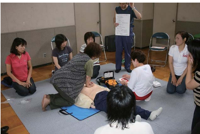
平成19年7月11日(水)9時00分~12時00分 宇和島地区婦人防火クラブ員53名が参加し、熱心に救急法AEDの使用法を学びました。