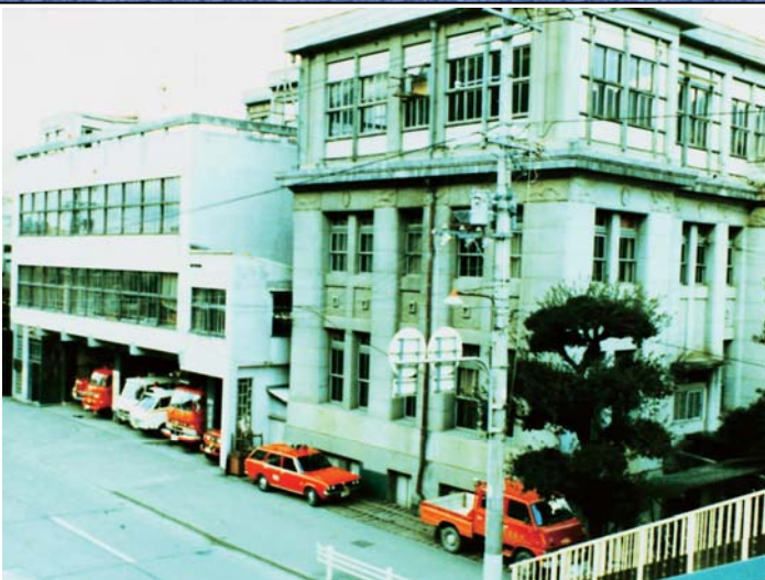
昭和40年代の旧消防署と市役所現在の南予文化会館（国道側の様子）